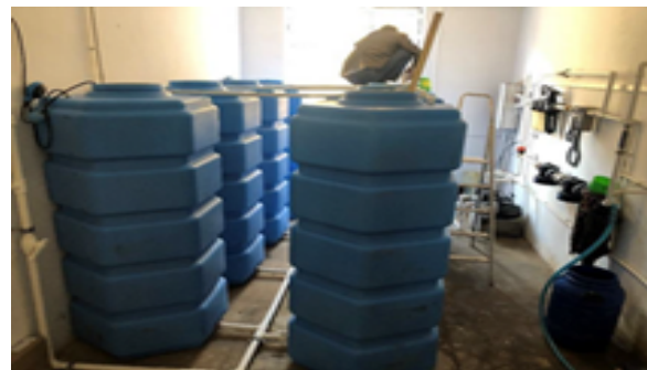
Bureau de l'association Water for Karakalpakstan à Takhiatash - www.karakalpakstan.net Coordonnées Google Maps : 42°19'38.5"N 59°34'24.7"E

La qualité de l'eau, en particulier en ce qui concerne les systèmes de filtration, est souvent évaluée en fonction de sa teneur en solides dissous totaux (TDS), qui est mesurée en parties par million (ppm). Le niveau de TDS donne une indication globale de la présence de substances dissoutes dans l'eau, y compris des minéraux, des sels, des métaux et d'autres composés inorganiques ou organiques. Voici comment la qualité de l'eau peut être interprétée en fonction du niveau de TDS :