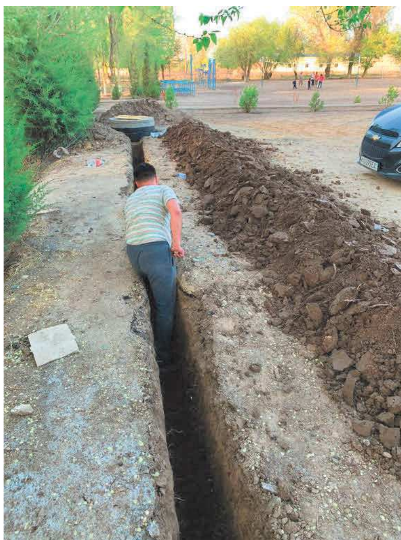
Local technique et travaux de fouilles pour le raccordement du puit au local technique