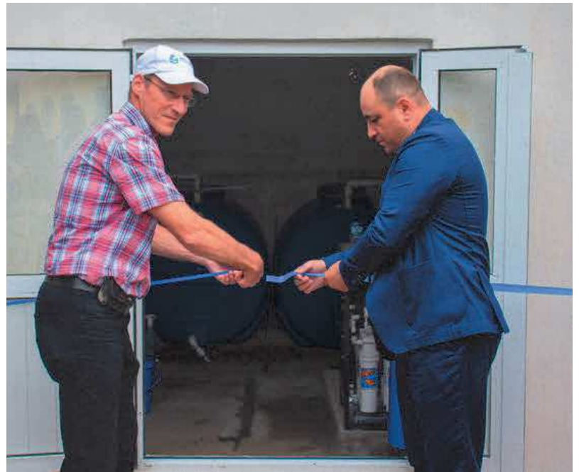
Cérémonie d'inauguration avec la coupure du ruban