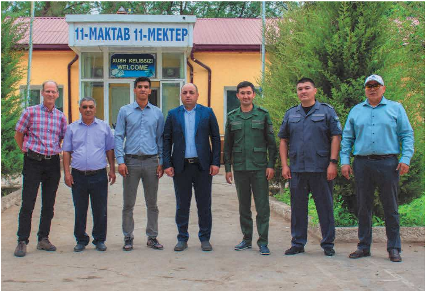
Directeur de l'école, Maire de Takhiatash, Chef de la police et de l'enseignement du district, directeur de l'IICAS, Manager du PNUD/UNDP, enseignants et partenaires locaux.