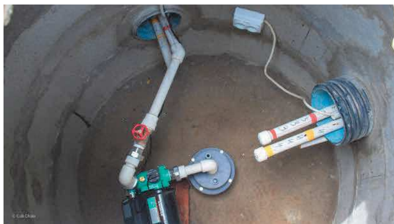
APRES : Chambre enterée avec pompe électrique, aspirante et à pression