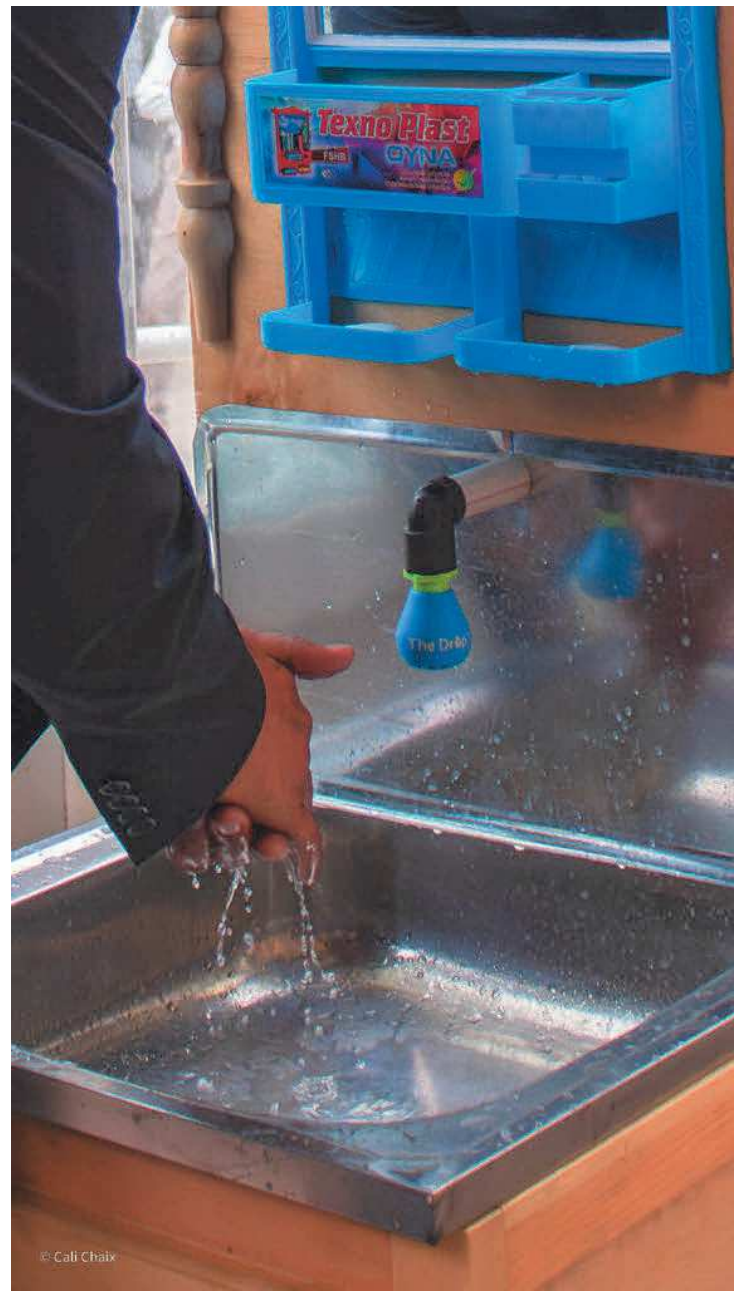
Lavage des mains avec le dispositif The Drop® et schéma de principe de l'installation de traitement d'eau